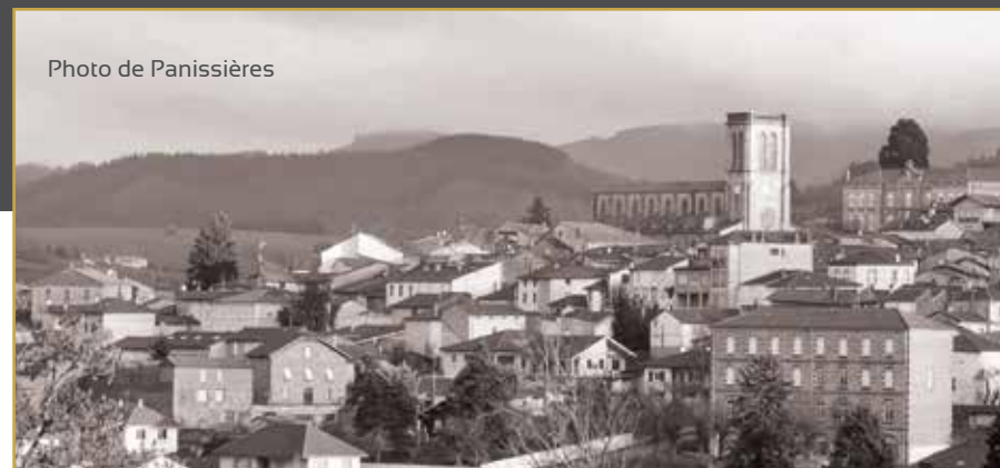
Photo de Panisières