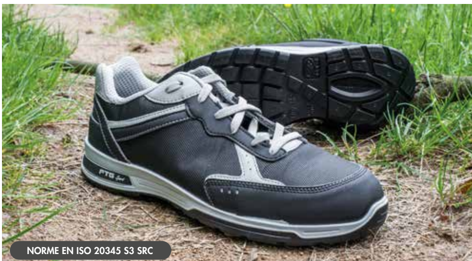
NORME EN ISO 20345 S3 SRC