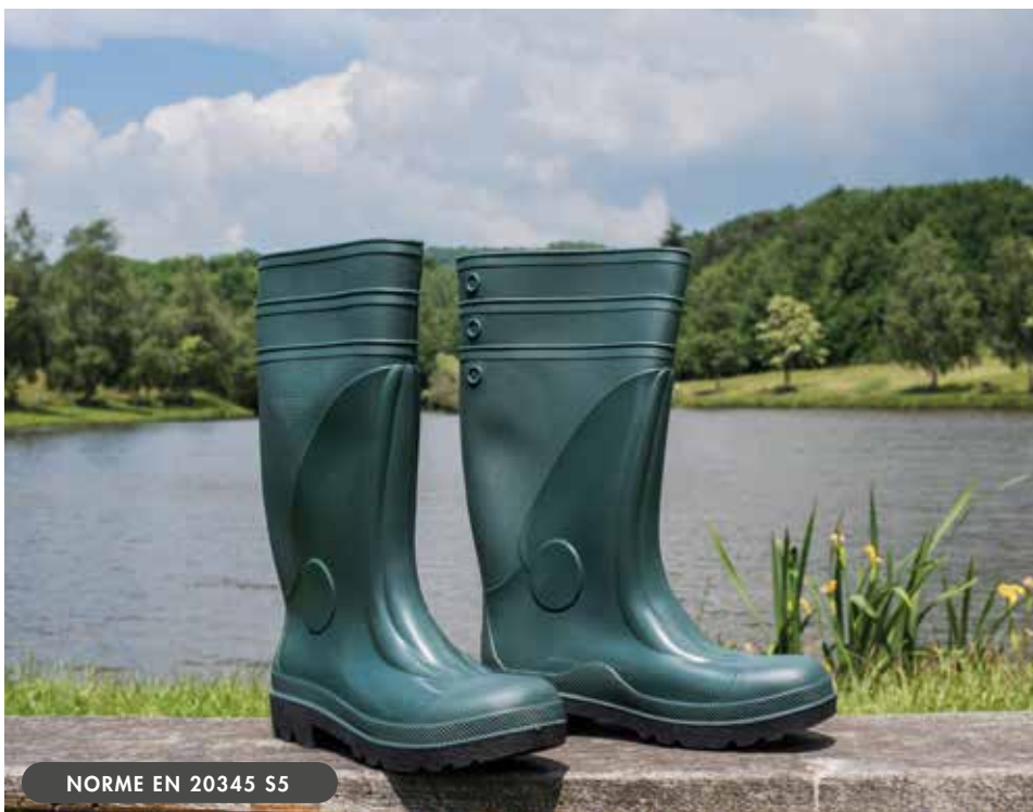
NORME EN 20345 S5